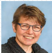
I. Thomann Auftragsbearbeitung